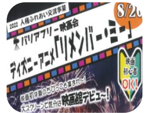
★バリアフリー映画