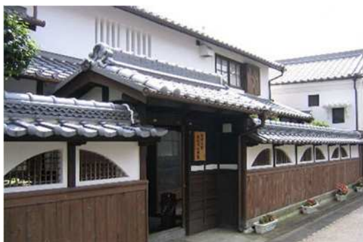
おおくぼまちづくり館