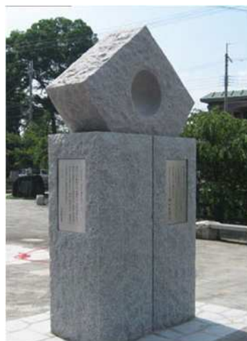
水平社博物館前にあるモニュメント 「いのち燦燦(さんさん)の塔」