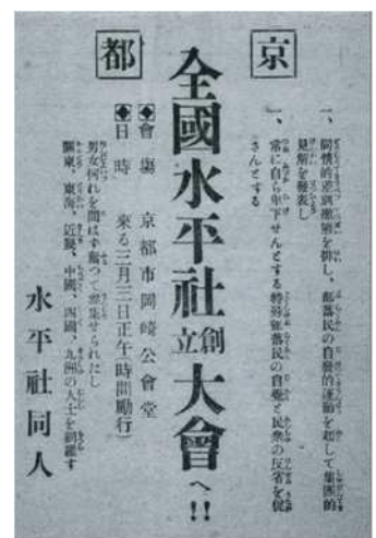
全国水平社創立大会への 参加呼びかけチラシ